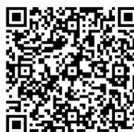
団体構成員名簿QRコード